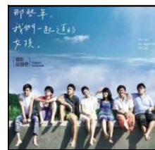
那些年，我们一起追过的女孩

有个导演曾说对于观众的审美心理来说，最美丽的就是感情将爆发宣泄前克制隐忍的那个瞬间。《One Day》将这个瞬间拉长放大，放在人生这个大坐标系里，于是它们成了20个一天——每一年，同一个时间，一次无需寒暄又戛然而止的约会——美丽得恒久而纯粹。爱情最动人心弦、柔肠百转的部分不就在欲说还休、将破未破之时吗？最甜蜜的忧伤，最痛苦的热忱，也都来自不能明了、不能直露的感情克制。美丽的爱情从来不是直白的，轻易出口的爱字太浅薄，挂在嘴上的盟誓太苍白，永远在倾倒的恋语太廉价，分分秒秒的相守太让人厌倦，爱情的魅力在于隐晦和含蓄。相隔的思念和埋在心底的爱恋，这是最能触痛我们那根纤弱的爱情神经的。